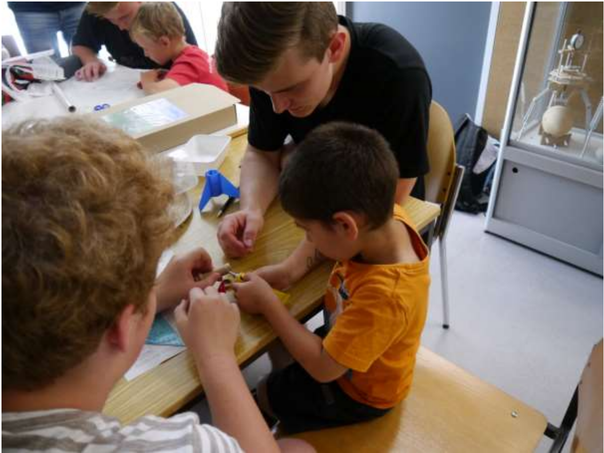
auch Leimraupen wollen geklebt sein