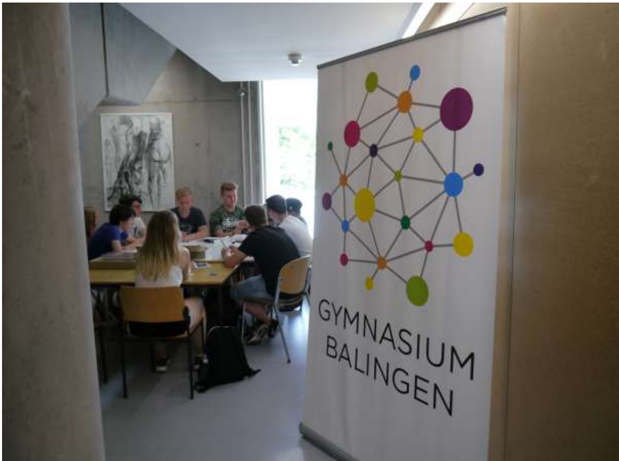
die Ruhe vor dem Sturm