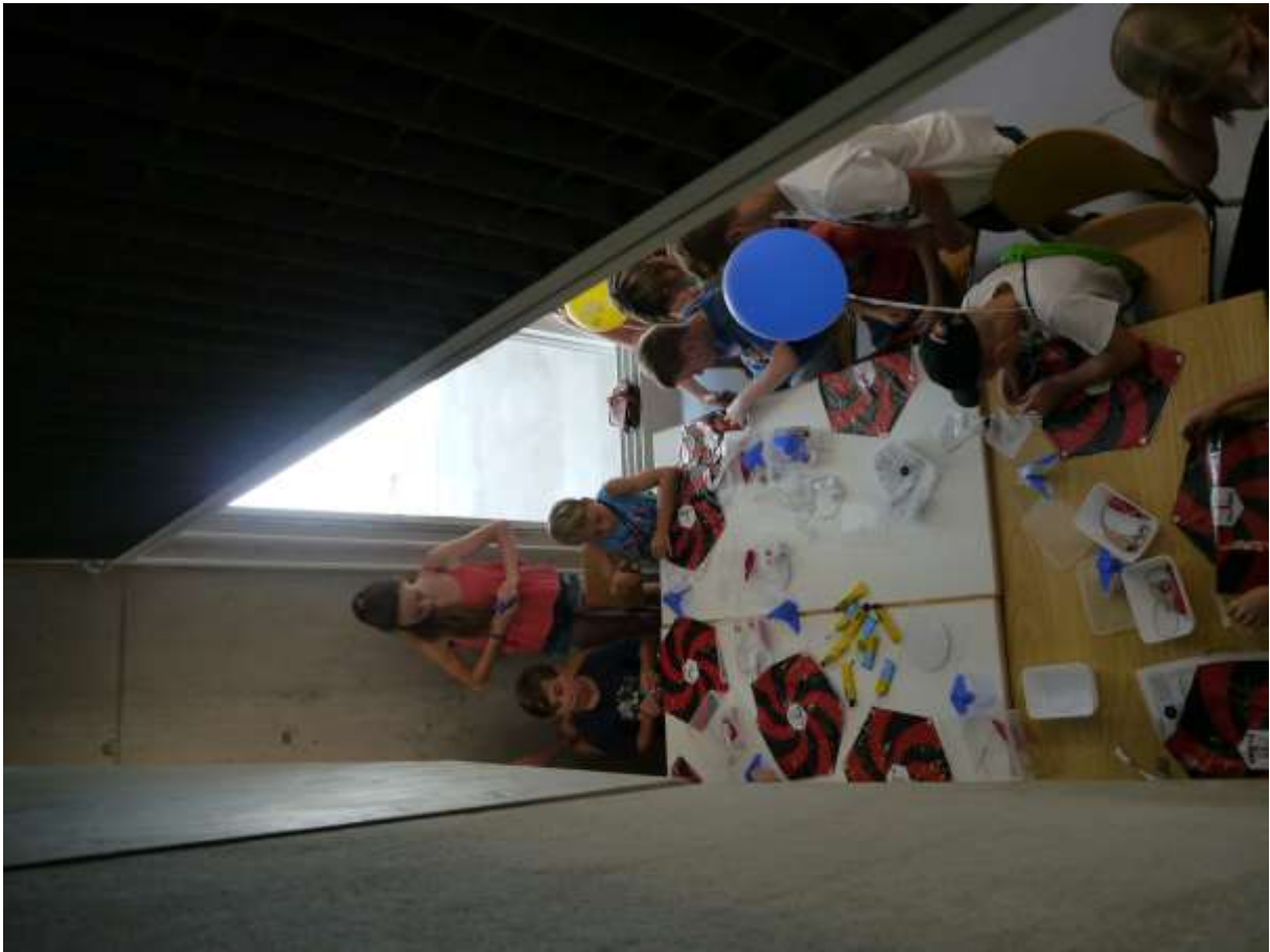
viele bunte Fallschirme