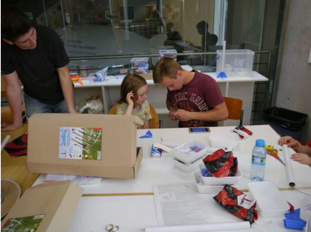
so wird's gemacht