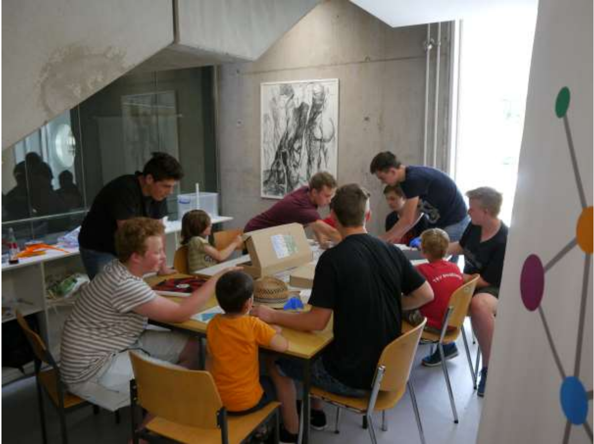
mehr zu tun als gedacht